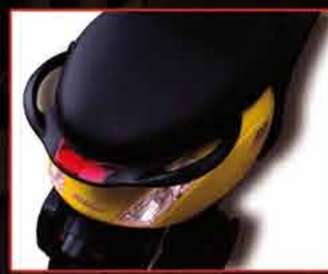
Tay dắt sau mới tiện lợi hơn