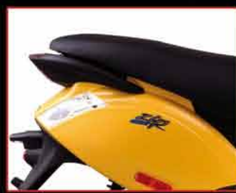
Yên xe dài hơn tạo sự thoải mái tối đa

Zip 100 mới với nhiều cải tiến về kiểu dáng và đặc tính kỹ thuật nay đã có mặt trên khắp hệ thống phân phối chính thức của Piaggio Việt Nam.