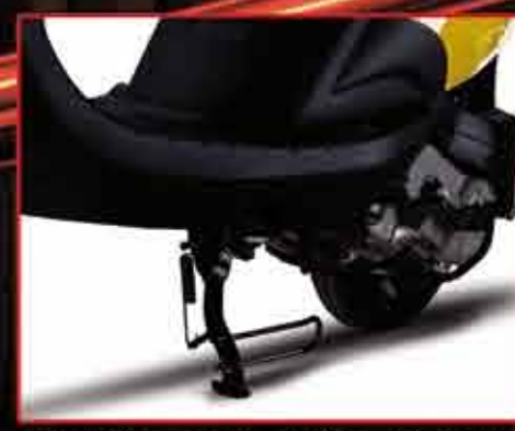
Hệ thống chân chống điện giúp tắt máy hoặc chống nổ máy khi chân chống hạ xuống